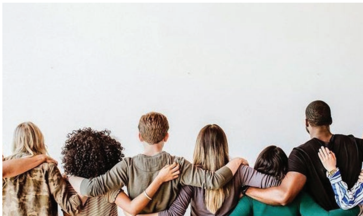
APPRENDIMENTO, QUI, SIGNIFICA ANCHE RELAZIONI E SOCIALITÀ

A l quinto posto tra le lingue più utilizzate al mondo, il francese oggi conta 300 milioni di parlanti, madrelingua e non. Entro il 2050 si prevede a livello mondiale una crescita fino a 700 milioni di francofoni, trattandosi attualmente del secondo idioma più studiato subito dopo l'inglese. A tenere alta l'asticella in termini di apprendimento, a Firenze, oggi è l'Institut français. Eccellenza riconosciuta e affermata nel proprio settore, la scuola apre le porte della sua sede, Palazzo Lenzi, proprio nella giornata odierna, al fine di permettere a esperti, appassionati o semplici curiosi di scoprire la ricchezza unica dell'offerta formativa e culturale. L'accesso è consentito dalle 10 alle 13 e poi nel pomeriggio dalle 14 alle 16. Un tempo, questo, durante il quale ragazzi, famiglie, adulti e bambini potranno addentrarsi nella bellezza rara di un sito storico come Palazzo Lenzi, divertirsi con giochi e animazioni su misura, partecipare - alle ore 11 - a una sessione di yoga